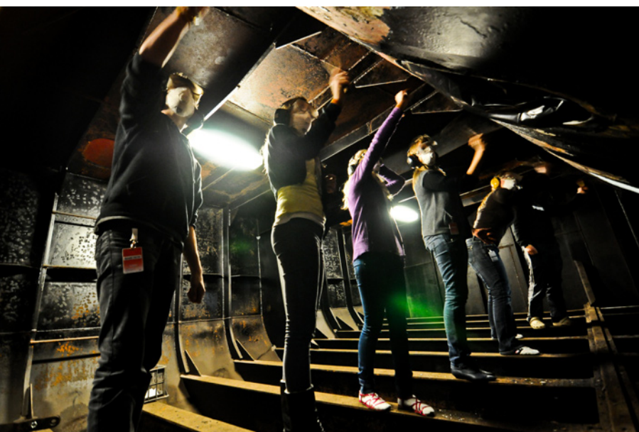
Een groep vrijwilligers is roest aan het bikken in één van de vele ruimtes onder in het schip.)