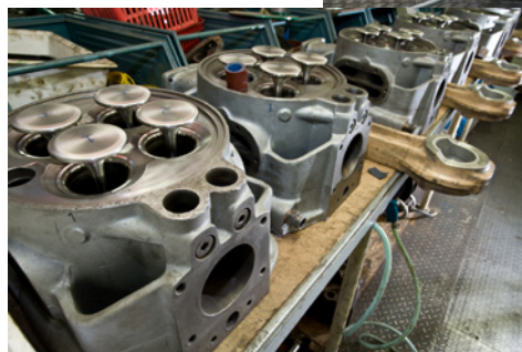
Cilinderkoppen, sommigen met hun bevestigingsstangen, klaar om geïnstalleerd te worden op de generator.