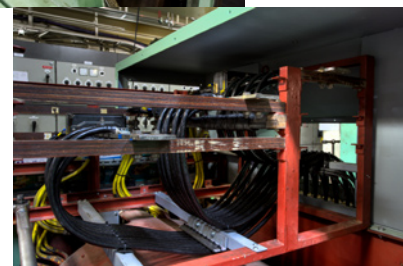
Interne bekabeling van de generator is klaar.

De installatie van de extra generator moet klaar zijn voordat de Logos Hope de 'PSSC' kan krijgen. Afgelopen zomer heeft het schip een generator gekregen welke, na enkele aanpassingen, zal lopen op zware stookolie, wat ongeveer de helft minder kost dan de dieselolie die het schip momenteel gebruikt.